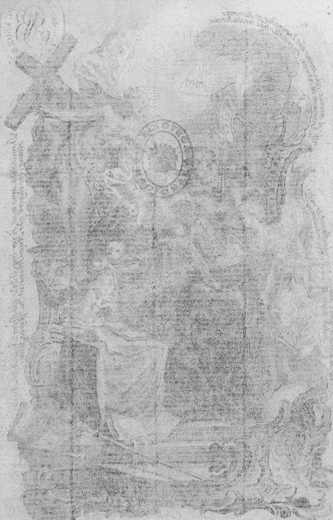
intercessio in Deum. 2.