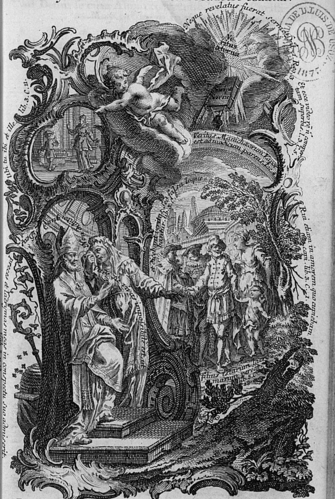
Incidi in homines carnales, garrulos et superbe delirantes, tenent in ore laqueos diaboli: lib. 3. Conf. C. 6.