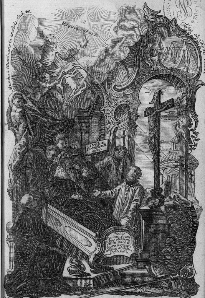
S. AUGUSTINUS ad coelum evolvans ex hac vita visus fuit in nube sedens Pontificalibus insignitus, cujus oculi quasi Solis radii