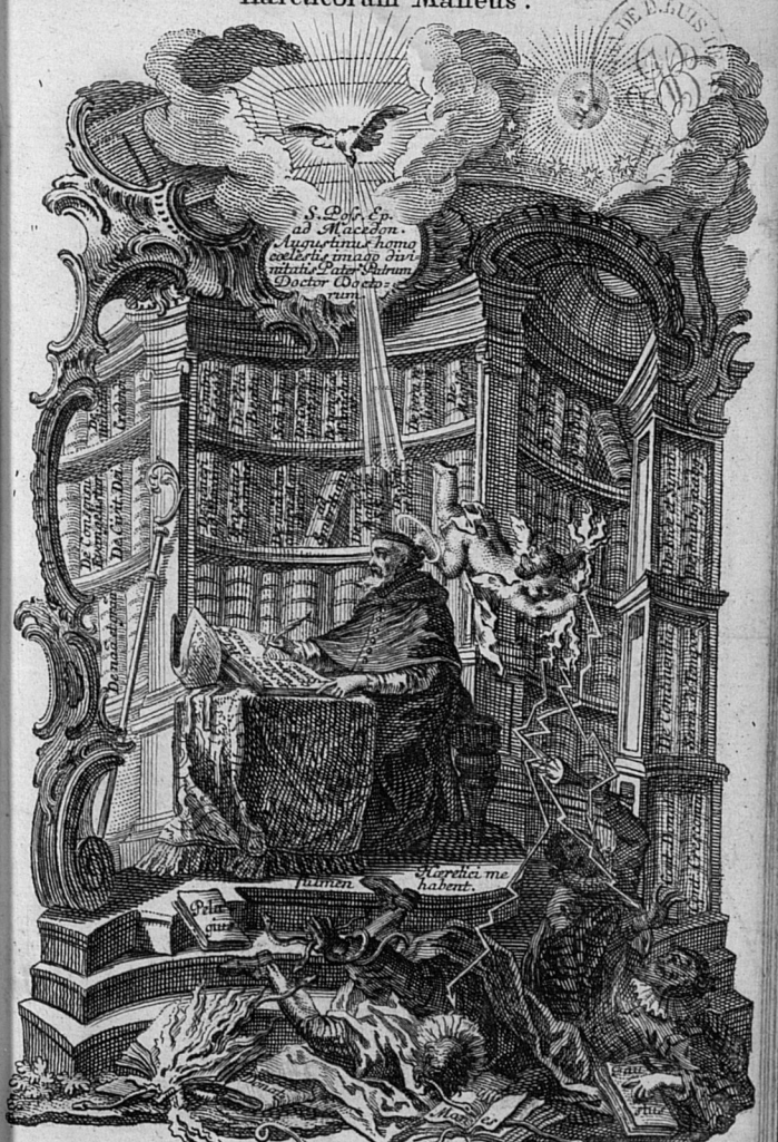
A Sole oīa afra lucent, ab Augustino, qui post ipsū fu erunt Docto- res, Sapientiæ humen accipiunt, ipse vero propria luce lucent, quam a