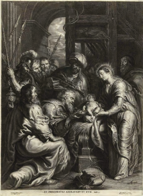
“Adoración de los Reyes Magos” Schelte Adamsz. Bolswert 1586 -1659 Grabado al buril PESSCA 0249A