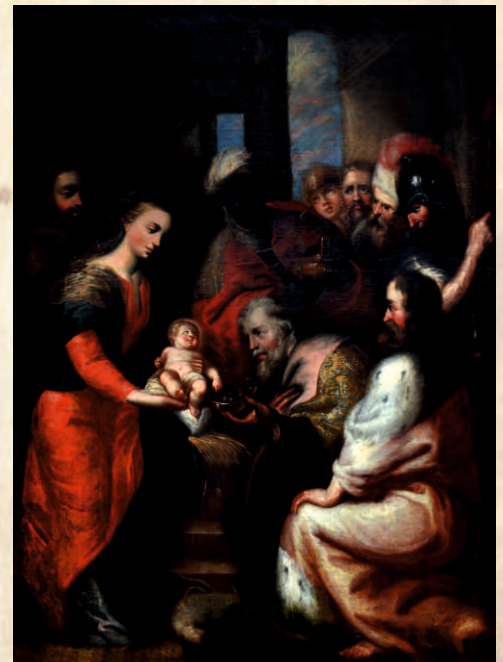
“Adoración de los Reyes Magos” Siglo XVIII Óleo sobre lienzo 112.5 x 84 cm. PESSCA 3544B