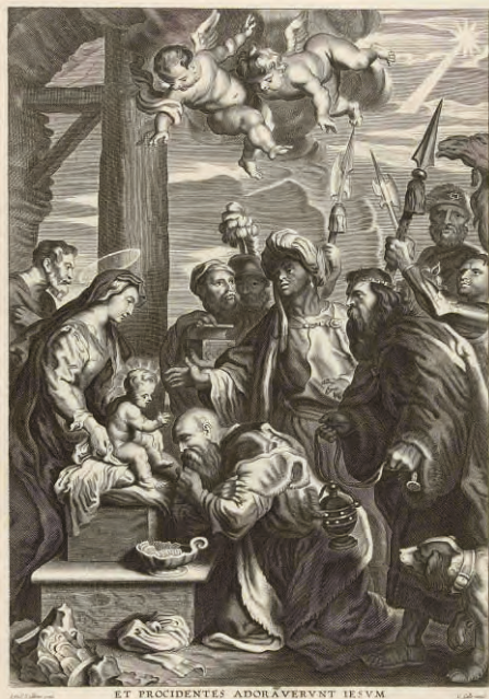
“Adoración de los Reyes Magos” Artista no identificado 1614 Grabado al buril PESSCA 0019A