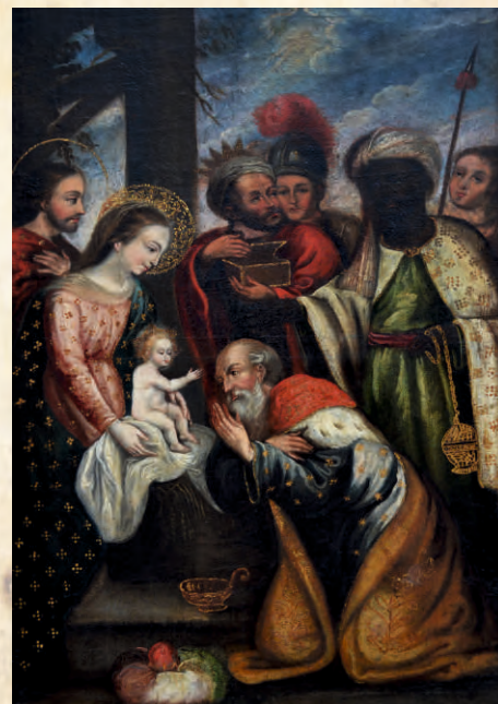
“Adoración de los Reyes Magos” Siglo XVII Óleo sobre lienzo 93.2 x 61 cm. PESSCA 3543B