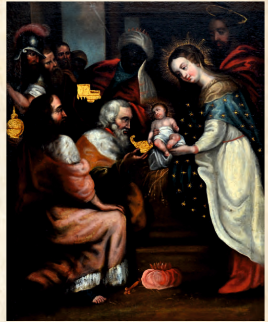
“Adoración de los Reyes Magos” Siglo XVIII Óleo sobre lienzo 62.7 x 48.5 cm. PESSCA 3545B